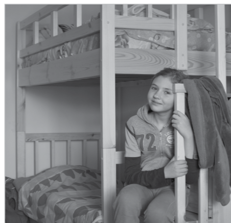
Двухэтажные кровати собирали все вместе!

— Привыкание происходит на удивление быстро. Все «новенькие» уже ходят в какие-то кружки, в воскресную школу, кто-то успел съездить с нами на рождественские каникулы, кто-то — поучаствовать в домашнем концерте. И наши постоянные жители приюта не смущаются, когда появляются «новички». Нет ни конфронтации, ни недоразумений. Конечно, сложно сохранить семейный дух приюта при таком количестве его жителей. Но я думаю, что, попадая в нашу среду, ребенок понимает, какой порядок у нас уже сложился, привыкает действовать по правилам и быстро