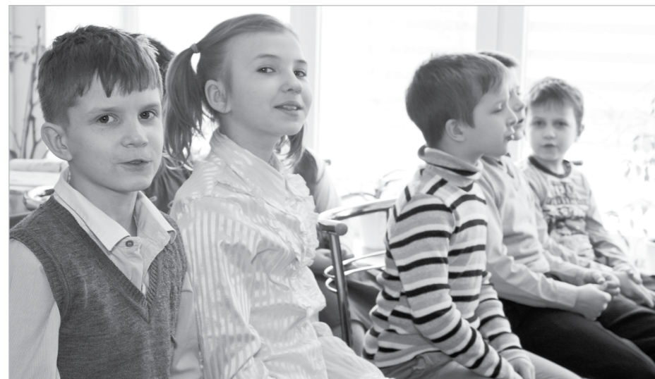
Новые воспитанники на уроке музыки

— Хорошо известно, что в приюте всегда стремились создать семейную атмосферу. Не изменилась ли она с появлением новых членов семьи? Насколько легко сами дети адаптировались к переменам?