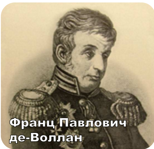
Франц Павлович де-Воллан

Вот почему название для нового города подбиралось с греческими корнями. Следуя указанной тенденции, Грибовский предложил три варианта названия нового города. Императрице понравилось второе в списке «Одесса». Богу одному известно, почему оно ей приглянулось более остальных, но воля монархини была отражена в указе, и городу, с тех пор и во веки веков, теперь предстояло называться именно так!