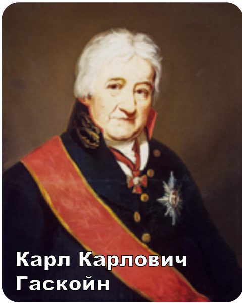
Карл Карлович Гаскойн

Дело об устройении Луганского завода и построения вокруг него города началось с открытия на речке Лугани английским ученым, промышленником и исследователем Карлом Карловичем