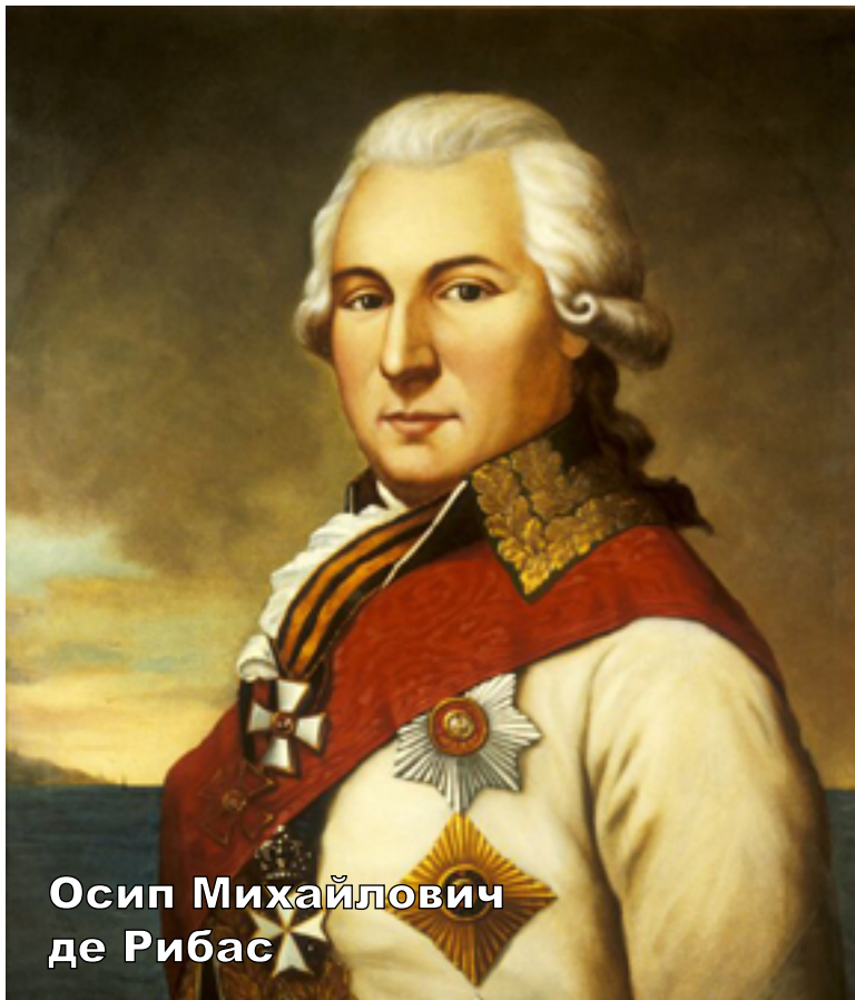
Осип Михайлович де Рибас

Контр-адмирал Осип Михайлович де Рибас не мог похвастаться столь высокими чинами и должностями, но его карьера развивалась весьма похоже. Этот испанец по крови родился в Неаполе и впервые на русскую службу попал, поступив офицером на русскую военную флотилию, которая под командой графа Алексея Орлова действовала в Средиземном море против турецкого флота. Человек крайне расторопный и «склонный к проидам», оказал командованию эскадры немалые услуги на суше и на море, действуя больше по части шпионажа, поскольку в то время Италия и острова Средиземноморья были ареной политических интриг многих государств. По некоторым данным он был одним из самых активных участников интриги с похищением самозванки, объявившей себя «княжной Таракановой» и заявлявшей претензии на русский престол.